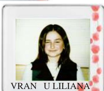
VRAN U LILIANA