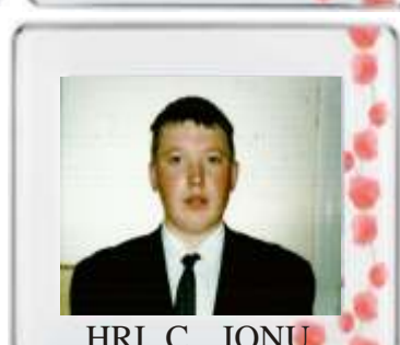
HRI C IONU